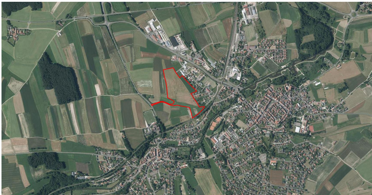
Abb. 1: Luftbild mit Geltungsbereich des geplanten Baugebietes

Wesentliches Ziel der Planung ist eine geordnete städtebauliche Entwicklung. Vorhandene Strukturen des Naturhaushaltes und des Landschaftsbildes sind soweit als möglich zu schonen. Weitere Ausführungen sind der Begründung zum Bebauungsplan zu entnehmen.