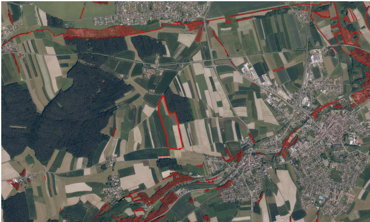
Abbildung 1 : Auszug aus Biotopkartierung

Es werden keine Flächen nach ABSP oder Biotopkartierung überplant. Kartierte Biotope befinden sich in mindestens 100 m und stehen nicht in funktionellem Zusammenhang mit den überplanten Flächen.