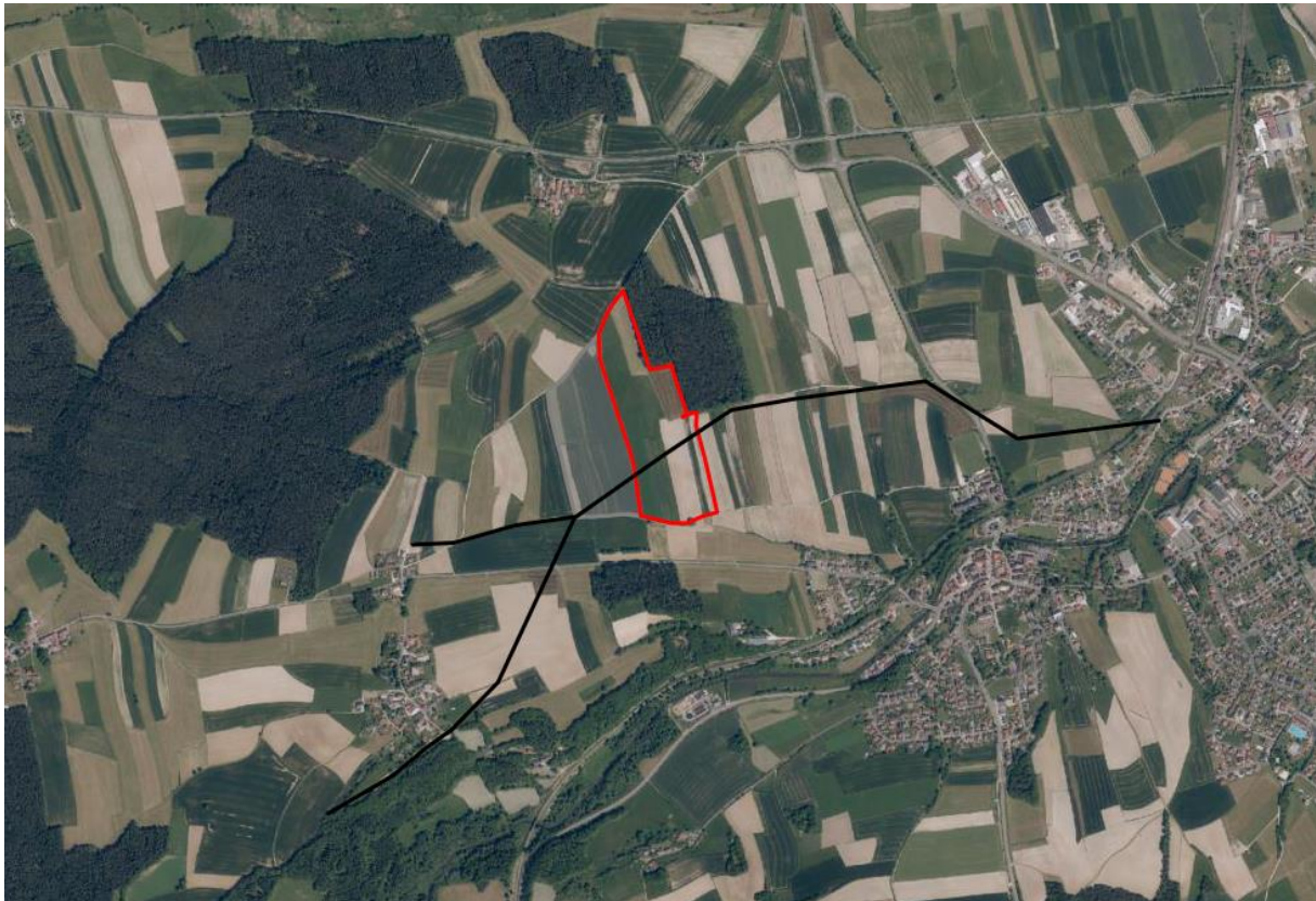
Landschaftsbild - rot: Geltungsbereich des Bebauungsplanes; grau: bestehende Anlage ; schwarz: Freileitung

Beim Blick von den umliegenden Ortschaften aus in Richtung der geplanten Anlage bilden die genannten Waldbestände aufgrund der Höhenentwicklung im Umfeld einen Hintergrund, vor dem die Module nicht so stark wahrgenommen werden wie auf einem Höhenrücken. In der Fernwirkung überwiegt die Horizontlinie des Waldes, siehe auch „Praxis-Leitfaden für die ökologische Gestaltung von Photovoltaik-Freiflächenanlagen, LfU 2014, Kapitel 4.1.1.